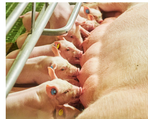
De melkgift van de met brij gevoerde zeugen is goed.