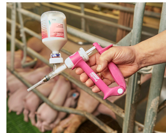
Biggen van drie weken krijgen met één prik drie vaccins.

Roelof Holdijk ziet snel resultaat van de koerswijziging op draaiend vermeerderingsbedrijf